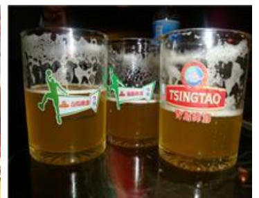
現地友人との宴にて (真ん中が著者) ビール博物館の試飲無濾過ビール